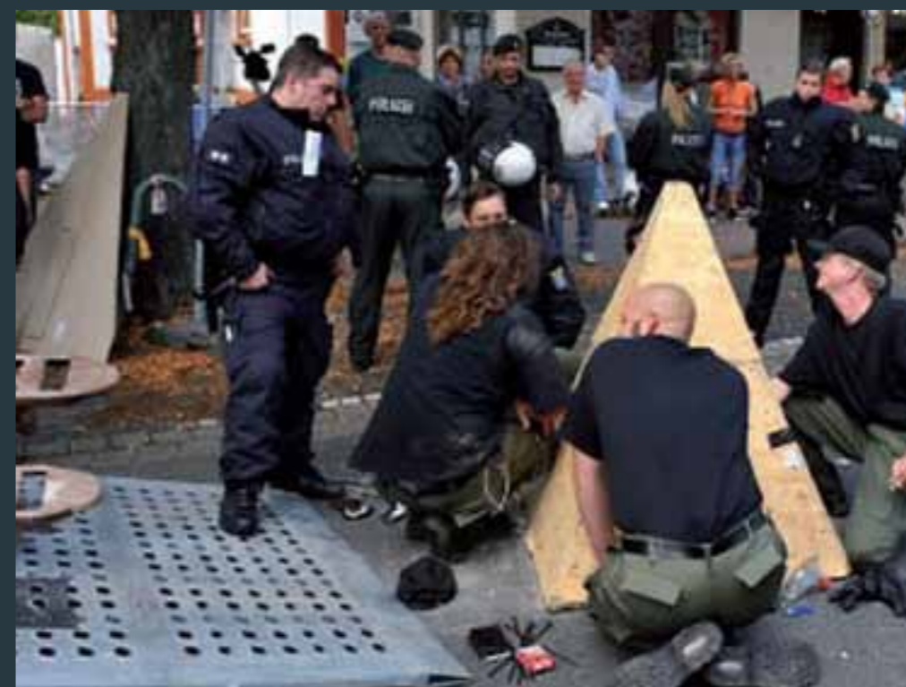
Blockade durch Betonpyramide