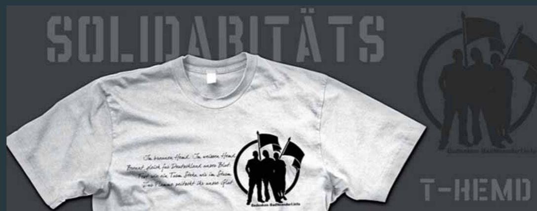
Nazi-T-Shirts 2011, von der Polizei verteilt, von den Nazis bedruckt