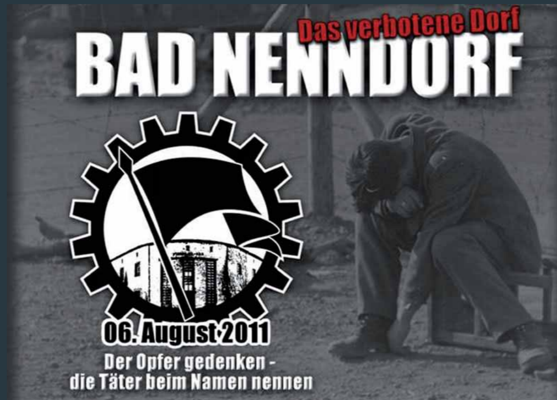
Nazisticker 2011: „Der Opfer gedenken, die Täter beim Namen nennen.“