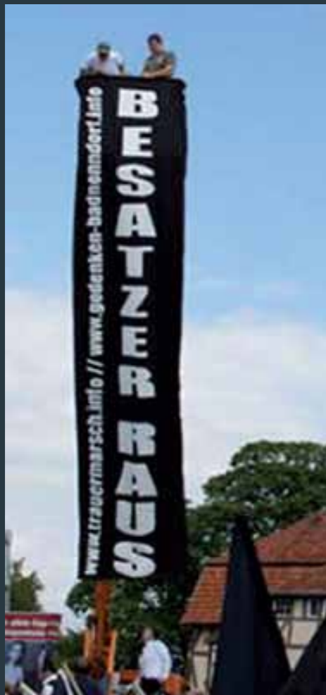
Aktion 2010: „Besatzer raus“