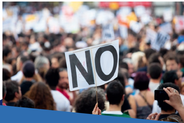
Proteste gegen Zwangsversteigerung

Die neue Syriza-Regierung hat angekündigt, auf nachhaltige Reformen zu setzen. So wurden z.B. 7.000 neue Ärzte eingestellt, die Privatisierung des Hafens von Piräus zunächst gestoppt und die Zwangsversteigerung des Erstwohnsitzes aufgehoben.